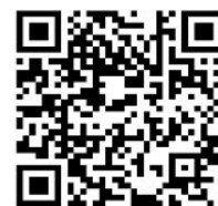
QR-Code zu den Erläuterungen & Unterlagen

Die Erläuterungen sowie zusätzlichen Unterlagen zu den Geschäften können spätestens ab Freitag, 29. Mai 2026 entweder auf der Internetseite der Gemeinde Thürnen (unter Politik → Gemeindeversammlung → Datum der Gemeindeversammlung ) oder zu den Schalteröffnungszeiten bei der Gemeindeverwaltung Thürnen eingesehen werden.